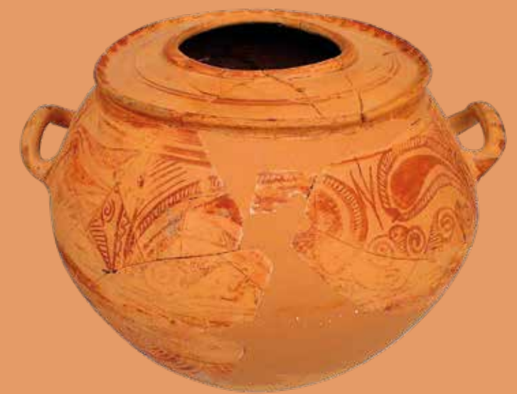
Gran tenalla de doble vora decorada.