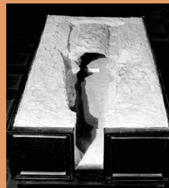
Maqueta del Forn, que es va presentar l'any 1929 a l'exposició El Arte en España: España primitiva (1929). Negatiu de placa seca de gelatina.