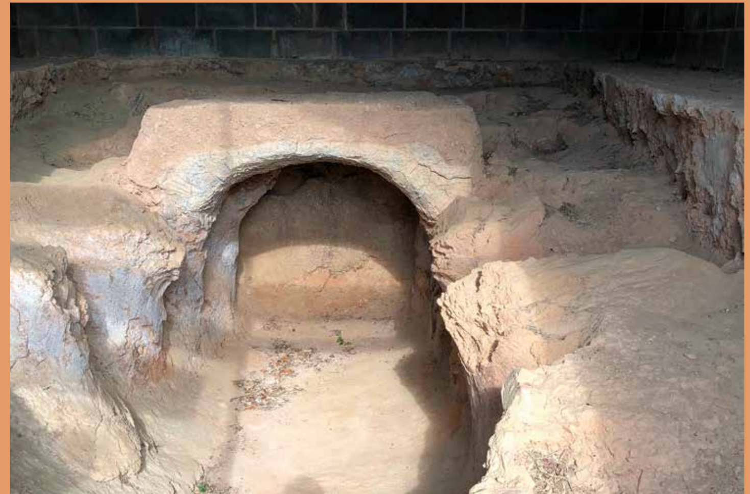
El forn de Fonscaldetes restaurat i reintegrat, tal com es pot veure ara.

Fotografia de Pere Català i Pic que mostra el descobriment del forn, el 1920. (Imatge: Arxiu Municipal de Valls/ Pere Català i Pic)