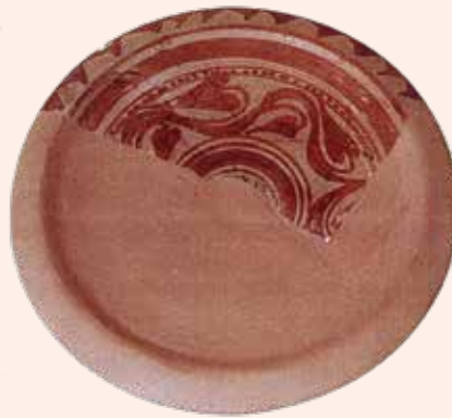
Decoracions singulars fitomòrfiques formades per tiges ondulants amb fulles d'arítol, cercells i fruites.

Tan sols en sortí un fragment de ceràmica ibèrica pintada.