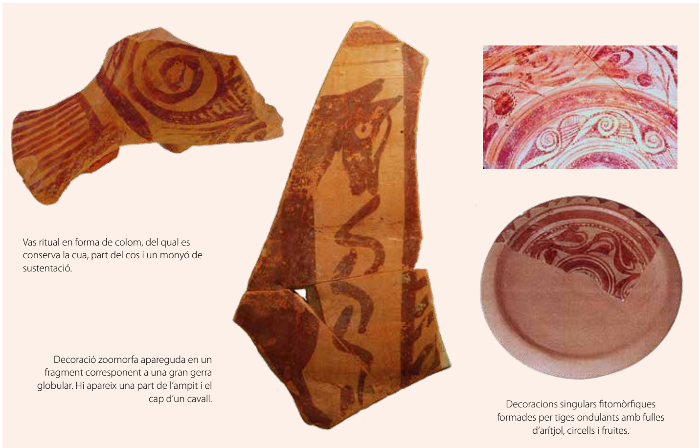
Vas ritual en forma de colom, del qual es conserva la cua, part del cos i un monyó de sustentació.