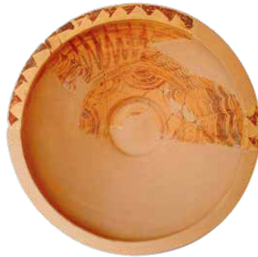
Els càlats (pàgina dreta) i els plats hemisfèrics són les produccions més conegudes dels tallers de Fontscaldes.

l’Anuari de l’IEC de l’any 1923 i el MAC conserva l’original del diari d’excavacions.