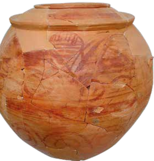
Gran tenalla de doble vora decorada.

Els materials de l’excavació van iniciar aleshores un llarg camí itinerant per dependències oficials fins arribar, l’any 1954, a la seva ubicació definitiva al Museu d’Arqueologia de Catalunya (MAC), on actualment es conserven trenta capsos (20 x 25 x 35 cm) amb material no reconstruït (menys d’1 m cúbic). J. Colominas va publicar un resum dels resultats de l’excavació a