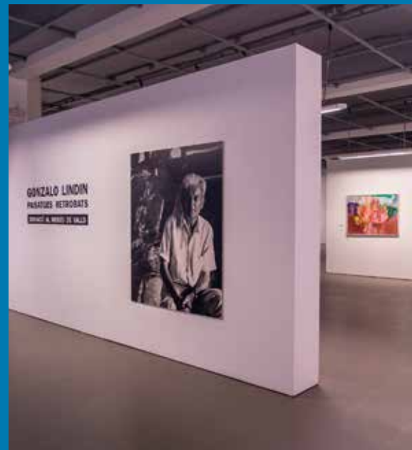
Exposició "Paisatges retrobats" al Museu de Valls.

_grisa o vermella_ dels conglomerats que la configuren i que, per l'erosió, sedimenten les terres de l'entorn. Amb identitat pròpia, destaca i es repeteix la forma del potent promontori de Siurana.