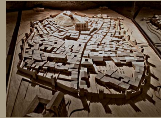
LA MURALLA DE MONTBLANC