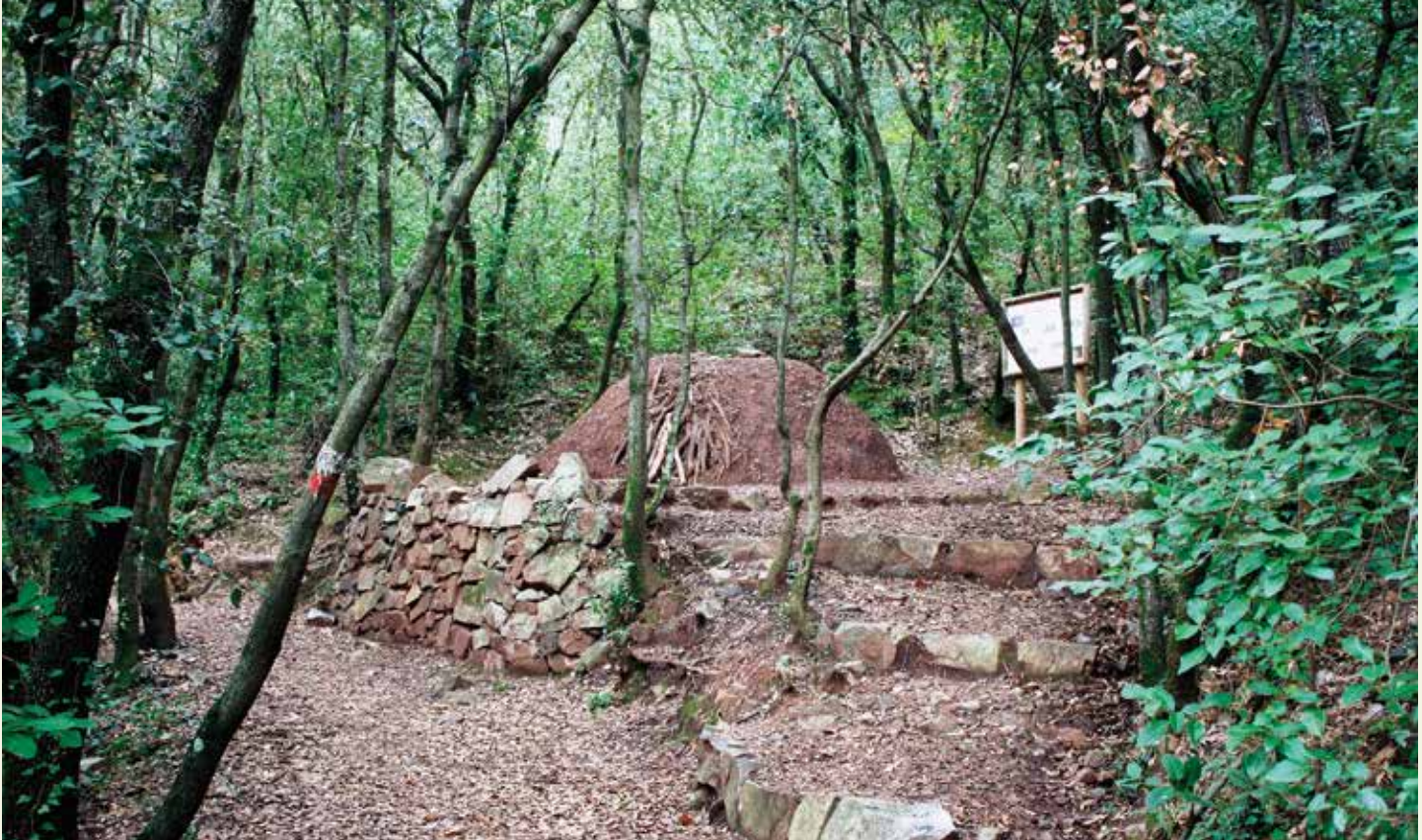
Recreació d'un carbonera a l'alzinar de la Pena.