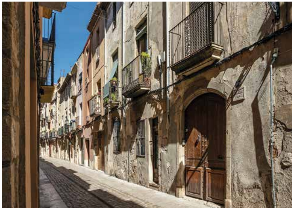
Casal dels Josa II , gran edifici del segle XVIII situat davant de l'antiga església de Sant Francesc · Casa de la família Molins , edifici barroc del segle XVIII, al carrer Major.