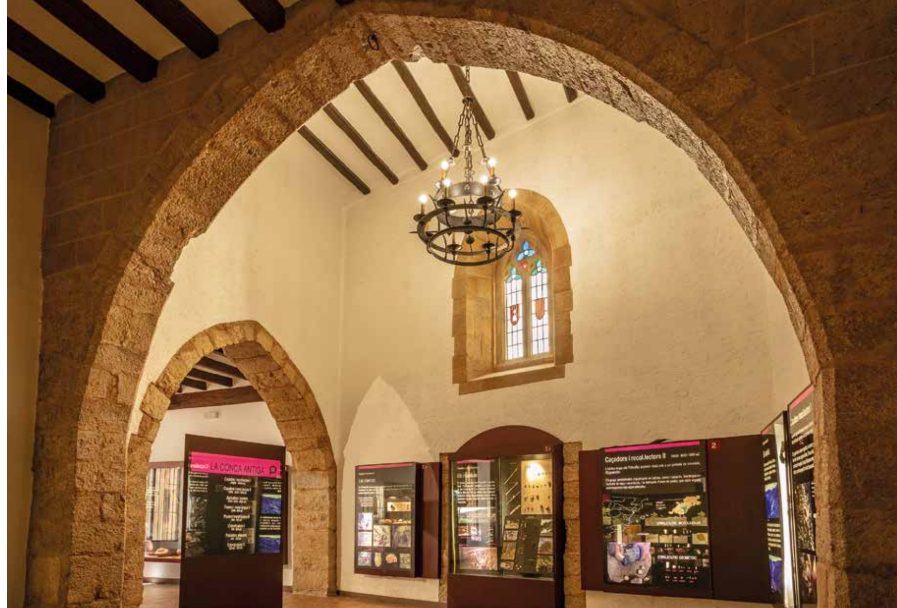
Casal dels Josa, planta noble amb arcades gòtiques, convertides en sales d'exposició del Museu Comarcal de la Conca de Barberà.

Per la porta s'accedia a una sala de distribució, coberta amb voltes rebaixades de maó de pla, amb llunetes als costats, vestibul que permetia lateralment anar a les cotxeres, quadres i cellers i, per la part central del fons, pujar per una escala noble de graons de pedra a la primera planta. Aquesta escala rep il·luminació d'una magnífica llanterna octogonal amb un finestral a cada cara, decorada interiorment amb pilastres i cornises motllurades amb guix molt ben resoltes i culminada amb una cúpula de maó arrebossada de guix. De la sala noble roman una part d'una pintura mural de caràcter heràldic i poca cosa més. El palau fou confiscat el 1936 pel