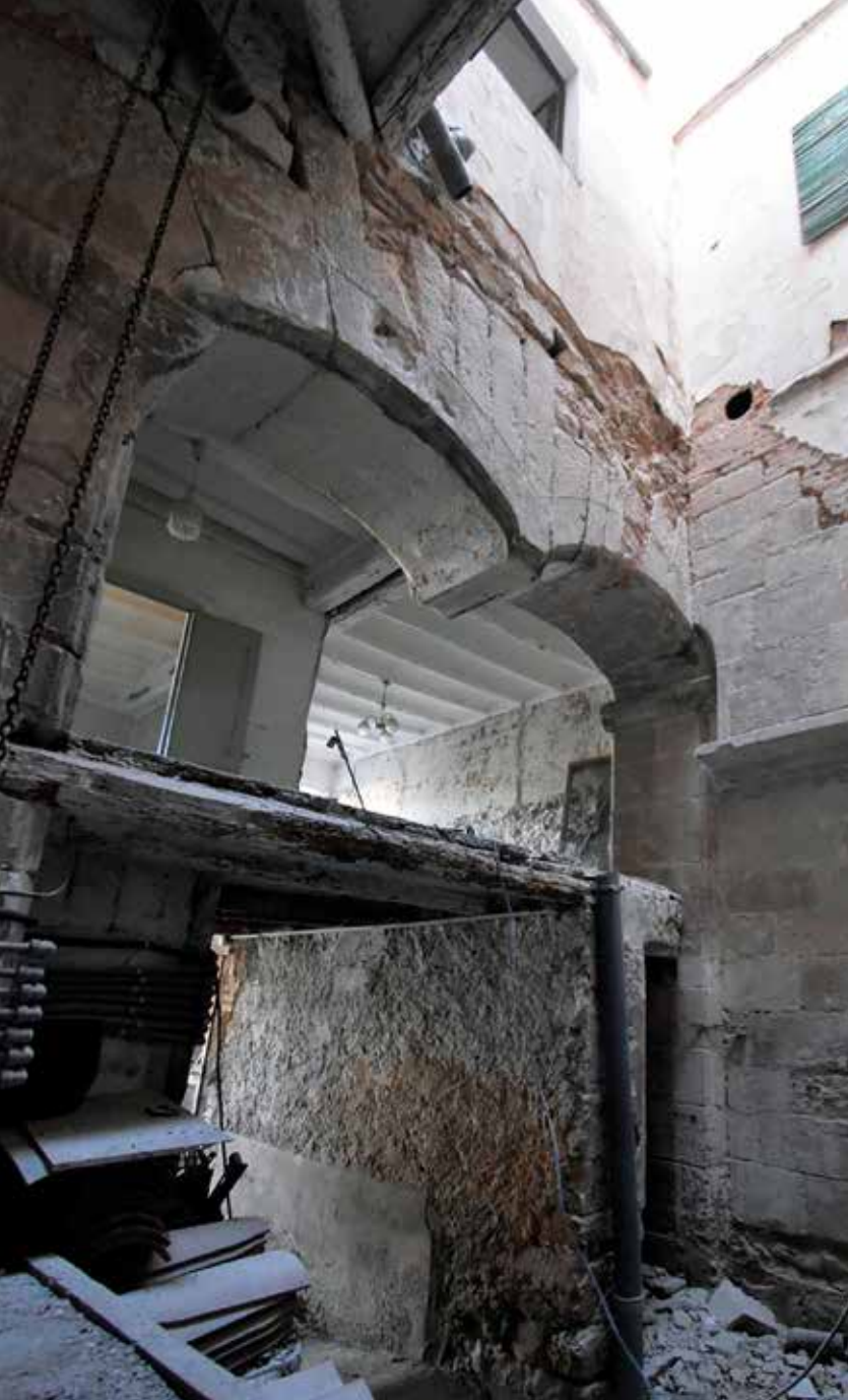
Palau del Castellà, dovella central penjant del pati interior. Palau del Castellà, 1563, data de construcció del palau.