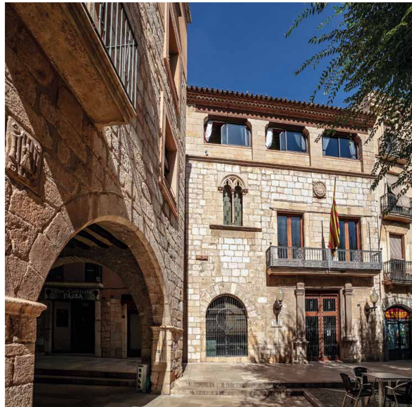
Casa de la Vila , palau del consell municipal des del segle XIV.

Les carmelites hi feren moltes reformes; reconstruïren la façana del carrer de Sant Isidre, tota feta de blocs de pedra, amb dues finestres coronelles gòtiques originals de tres obertures. La part inferior passà a realitzar les funcions de capella de la comunitat. Destaca l'escala interior del segle XVIII, amb cúpula i llanterna, decorada a inici del segle XX pels pintors Balanyà. La porta principal sembla obrada a mitjan segle XVI.