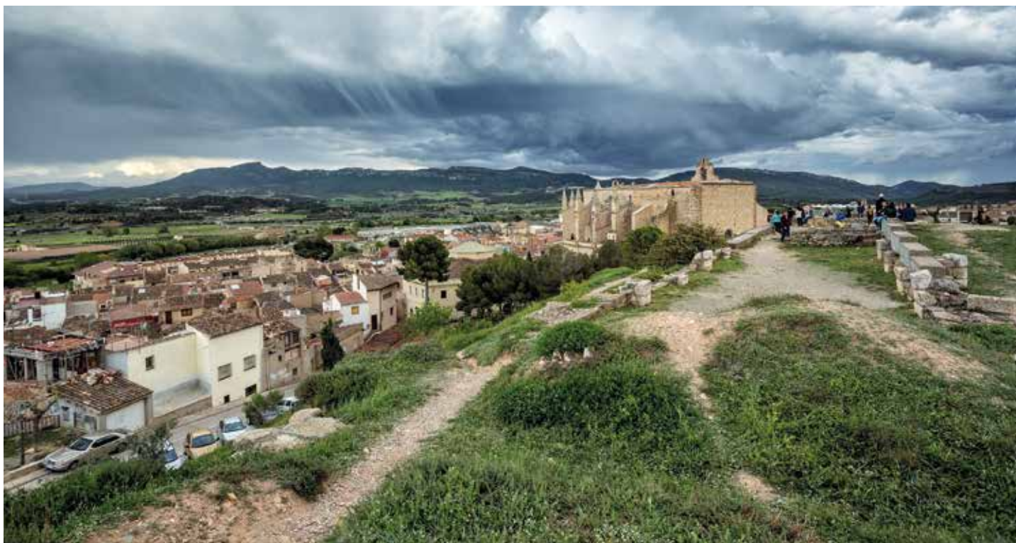
Castell de Montblanc , estava situat al Pla de Santa Bàrbara, el punt més elevat de la Vila · A la pàgina dreta: escala noble del Palau dels Marçal i dels Conesa , avui seu del Consell Comarcal de la Conca de Barberà.