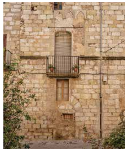
Palau dels Alanyà, detall de l'antiga estructura gòtica.

va quedar en mans de particulars que n'han desfigurat la façana noble. A la darrerria del segle XIX, acollí l'Associació Catalana. Durant el segle XX ha estat habitatge de particulars. La façana data del segon quart del segle XIV, feta tota ella amb carreus de pedra, amb tres finestres coronelles de tres obertures i dos portals adovellats de mig punt. El nom tradicional i actual de la placeta "de Don Guillem de Llordat" recorda el llinatge que el posseï durant els segles XVI i XVII. El Palau dels Alanyà espera una mà amiga que el restauri.