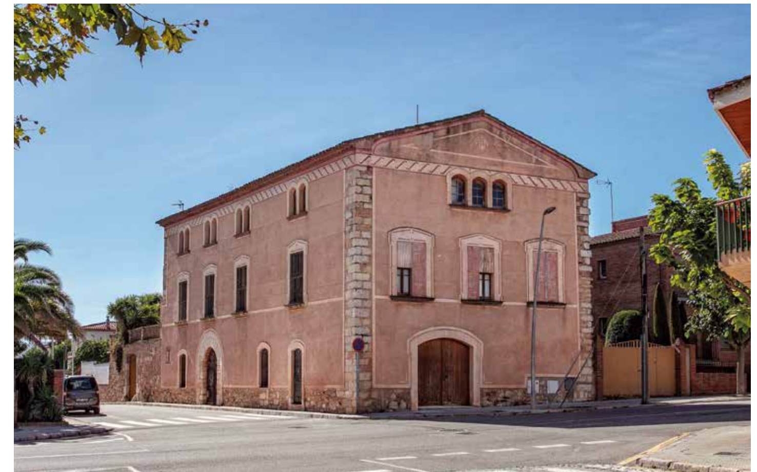
Casa dels Aguiló II , data del segle XVI, situada a l'antic camí de Tarragona en el lloc que ocupava l'antic hospital de Sant Bartomeu, documentat al segle XIII.

El visitant que vulgui anar a Montblanc podrà veure molts més edificis i construccions que les que en aquest article haurà descobert. Restava encara algun palau medieval del qual no hem pogut esbrinar-ne la història i la dels seus propietaris, com el que hi ha al carrer Major, núm. 20, amb façana de blocs de pedra, portal adovellat, finestres coronelles i galeria superior. També hi podrà admirar altres casals vuitcentistes, així com una interessant residència noucentista en tota la seva esplendor, coneguda com "cal Cardús" (carrer de la Font del Vall, 33) i, a més, alguna altra casa decorada a l'estil modernista (com cal Robusté, a tocar del portal de Bové al carrer de la Muralla Santa Tecla, núm. 42). I això sense oblidar el notable conjunt d'edificis religiosos, com les esglésies de Santa Maria, Sant Francesc, Sant Miquel o Santa Tecla; els monestirs de Santa Maria de la Serra, de Santa Maria del Miracle o dels mercedaris, l'hospital de Santa Magdalena i sense oblidar la més coneguda i emblemàtica construcció del cercle murallat bastit en temps del rei Pere III. La visita a Montblanc no us decebrà. ■