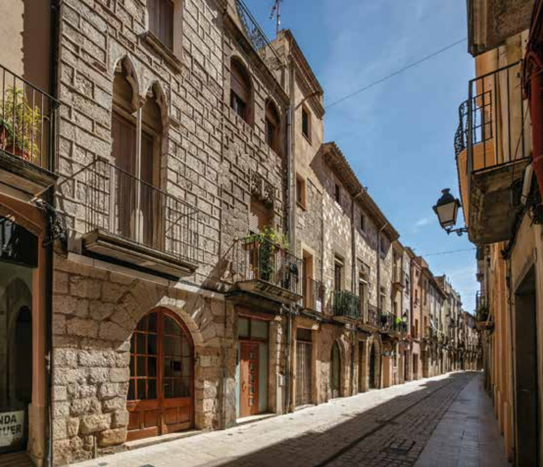
Casal dels notaris Alba , està format per diversos edificis contigus, dels segles XVI al XVIII. A la pàgina dreta: La Casa Desclergue , un dels palaus més coneguts de Montblanc, situat a la plaça major.