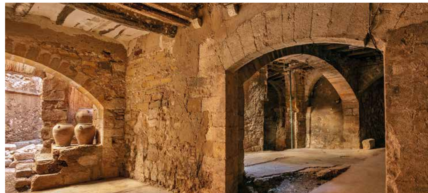
Palau dels Cervelló, l'estructura d'aquest important palau resta oculta a l'interior de l'edifici de la botiga Vives, a la plaça Major. Hi podem veure el conjunt de capitells arcades gòtiques que conformaven el pati interior que menava a la planta noble i la planta baixa amb arcades gòtiques. No és visitable.