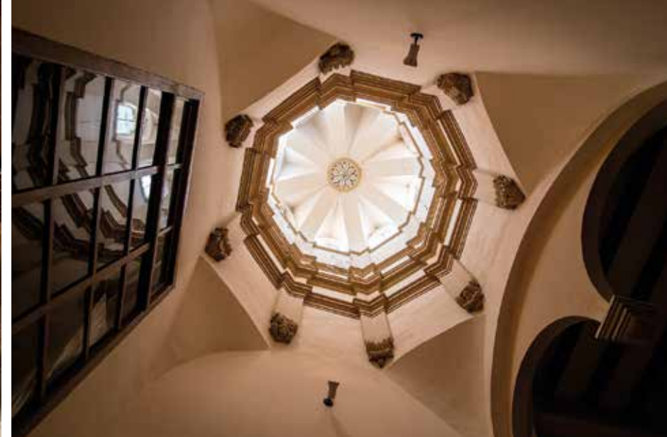
La Cort del Veguer i Palau dels Mestres, al carrer Major · Palau dels Castellví, interior de l'escala amb una magnífica llanterna octogonal.