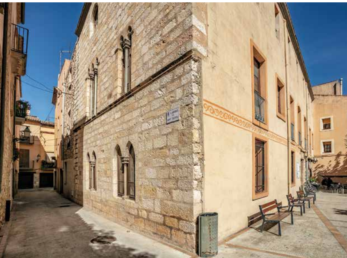
Palau dels Anglesola , conegut com les monges o el casal d'entitats.

àmplia flanquejada per una galeria d'arcs gòtics emplaçats al perímetre d'un pati interior. La planta inferior, tota construïda amb arcs gòtics, encara conserva bona part dels sostres originals fets amb elements de fusta. Una segona planta constituïa la sala noble, on també resten bona part dels elements originals de l'enteixinat medieval: jàsseres sobre permòdols de pedra que sostenien bigues soles, biguetes i posts de la coberta.