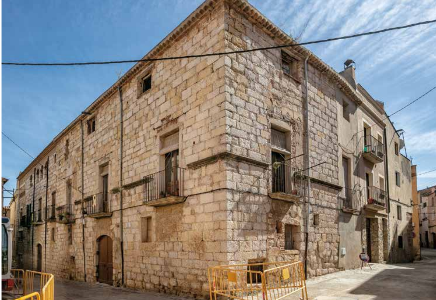
Palau dels Alanyà, conegut com a Palau Reial.