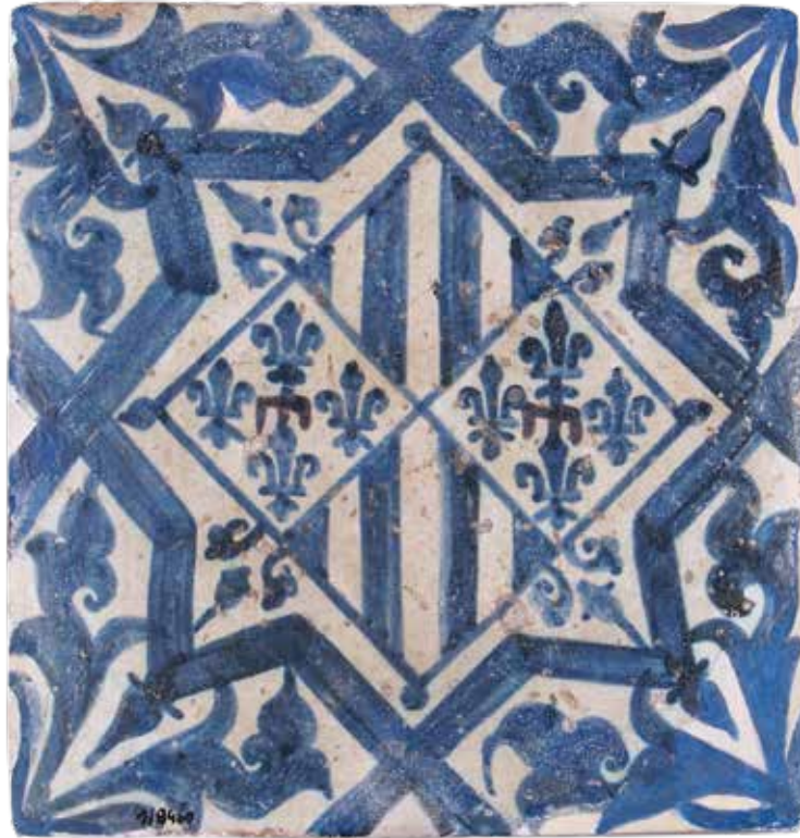
Taulell heràldic de la reina Margarida de Prades (s. XV)

Nau principal de l'església de Santa Maria del monestir de Santes Creus, al centre de la qual hi ha l'ossari que acull les despulles de les monges de Bonrepòs · Part posterior del mas de Sant Blai on s'observen restes d'una antiga construcció.