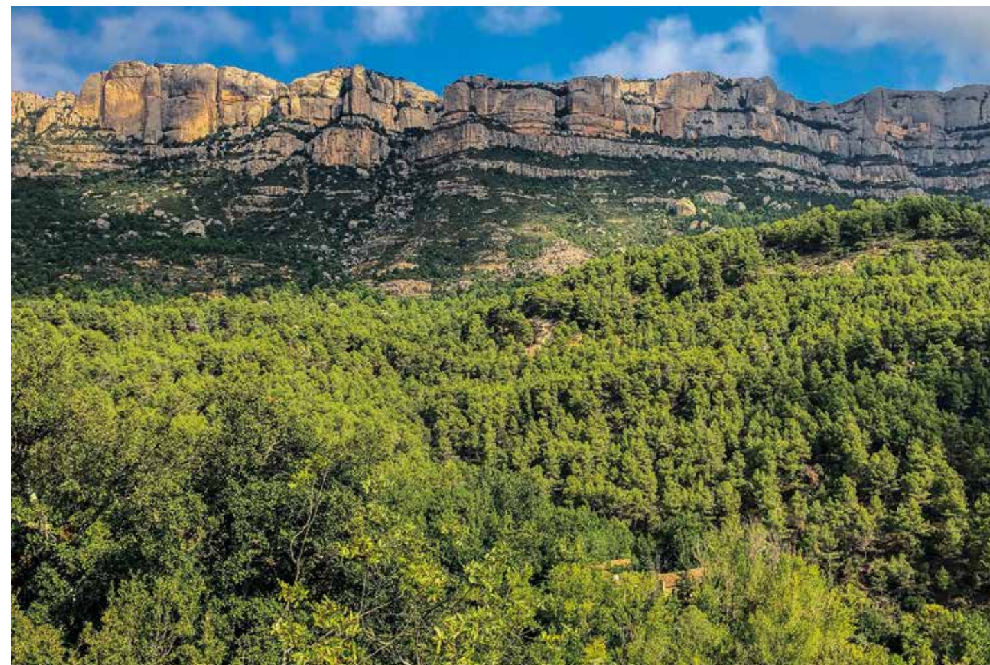
Emplaçament de Bonrepòs sota els cingles del Montsant, a la Morera de Montsant · A sota: Portalada del Mas de Sant Blai amb l'escut d'Escaladei.