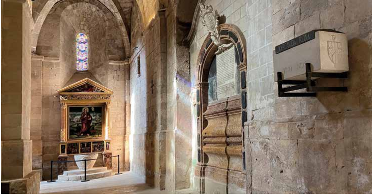
Urna funerària que recorda la reina Margarida de Prades a un lateral de l'església del monestir de Santes Creus.

O bé veiem com el comte, el 1352, alliberà el monestir de càrregues en tots els llocs i viles del comtat perquè es pogués recuperar dels danys de la pesta negra.