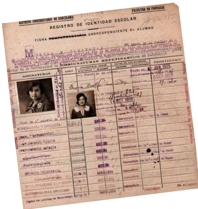
Expedient acadèmic de la Facultat de Farmàcia.