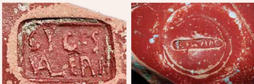
Marques dels tallers CYCES VALERI i FIRMUS trobades a la vil·la.