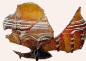
Bol de vidre decorat amb costelles en relleu.

En una copa del conjunt, a la part externa inferior del cos, va aparèixer un grafit amb una inscripció al·lusiva al seu propietari.