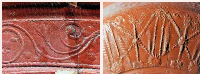
Detalls dels motius decoratius de les peces de ceràmica sigil·lada trobades.