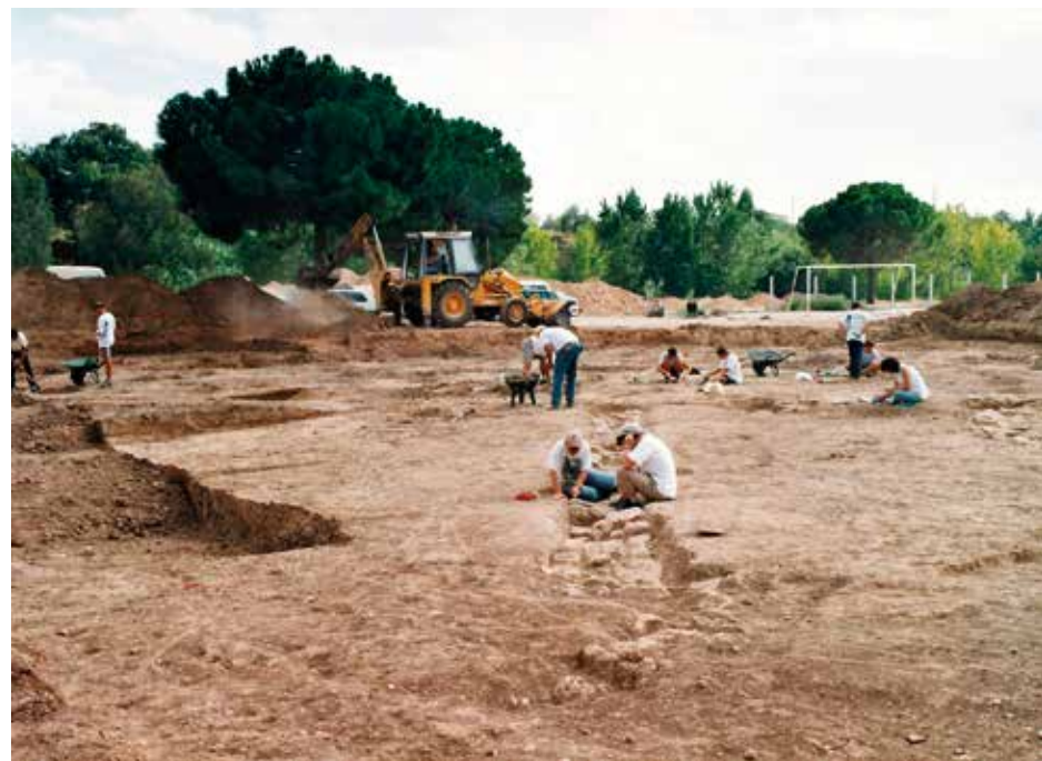
Diferents treballs a l'excavació de la vil·la.

la vil·la, en una petita riera o barranc poc profund. En aquest abocador hi van aparèixer grans quantitats de fragments d'àmfora que copien models ja plenament romans, com serien les imitacions de la forma grecoitàlica tardana o de transició i la forma Dressel 1A. Així mateix, van aparèixer àmfors locals ovoïdes de reduïdes dimensions (45-50 cm d'alçada). Malauradament, no es van poder localitzar els forns on foren elaborades, però sí que hi aparegueren nombrosos fragments de peces que presentaven deformacions i clars indicis de sobrecocció, la qual cosa demostra que existia una terrisseria d'àmfors romanes que seria, si no la primera, una de les més antigues que s'han documentat a la província de la Hispània Citerior.