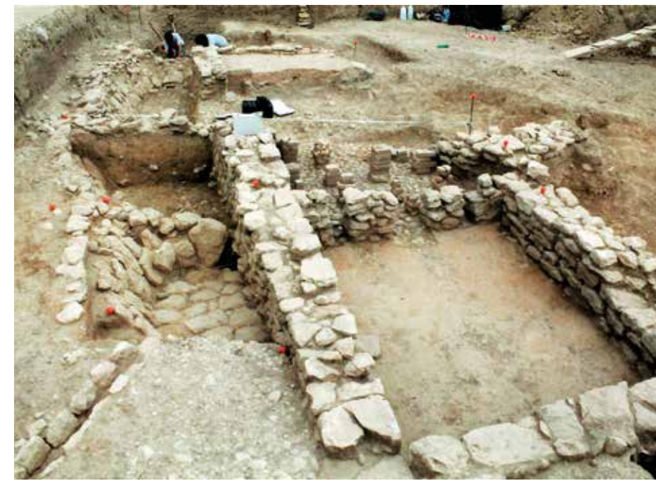
Superposició dels banys damunt dels antics dipòsits.

Es va suposar que el frigidarium (banys freds), que també podia funcionar com apodyterium (vestidor), es trobaria al nord del tepidarium , fora dels límits de l'excavació.