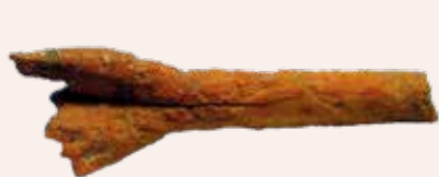
Bracet de nina de joguina feta amb os.