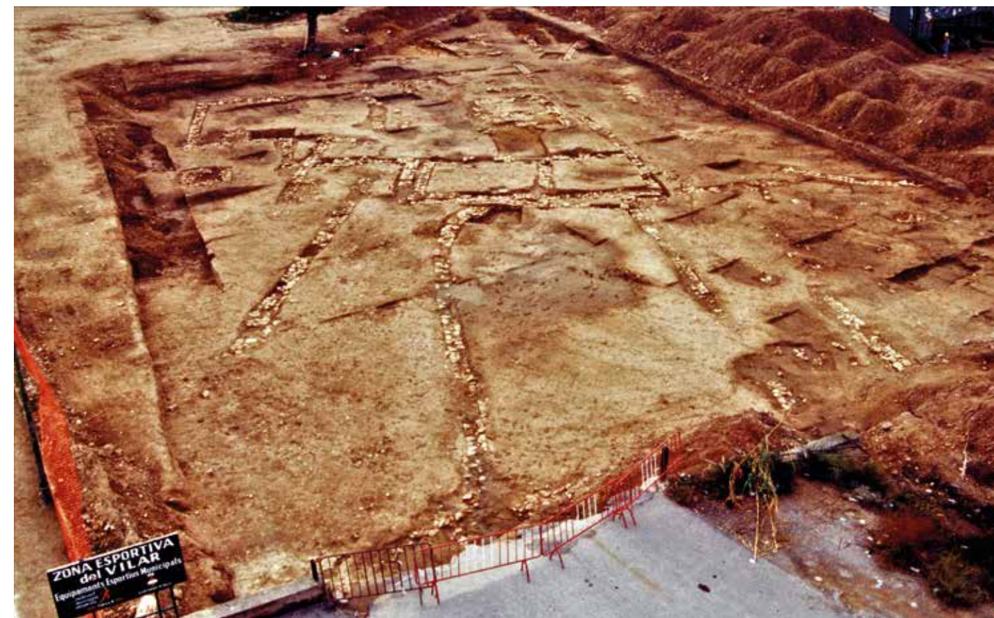
Excavació de la vil·la romana del Vilar (CODEX).

Entre els anys 2000 i 2002 es va portar a terme una important reforma urbanística que va afectar l'àrea de protecció del jaciment ibèric del Vilar. Els treballs arqueològics previs van aportar una destacable troballa amb l'aparició d'unes restes d'època romana desconegudes fins aquell moment i que es situaven als peus de l'antiga ciutat ibèrica.