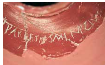
E[...]us est Parissivs Minicivs

En una copa del conjunt, a la part externa inferior del cos, va aparèixer un grafit amb una inscripció al·lusiva al seu propietari.