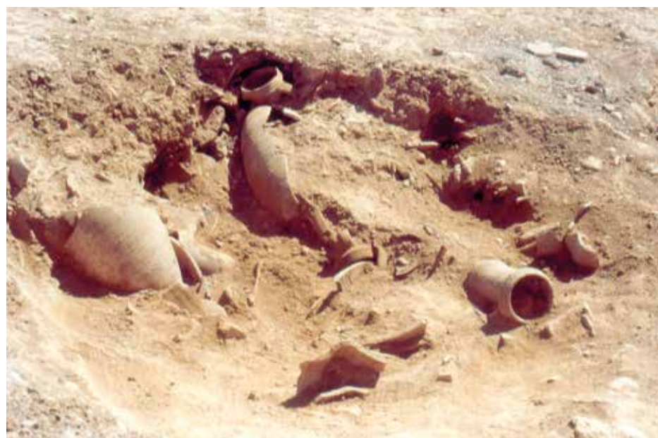
Detall de l'aparició d'àmfors a l'abocador.

També dins la pars rústica destacava l'aparició d'una estança amb una dolia encaixada, dos fornets de petites dimensions que compartien un dels