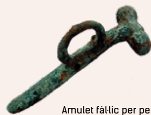
Amulet fàl·lic per penjar al coll. Es considerava un talismà contra el mal d'ull i afavoria la bona sort.