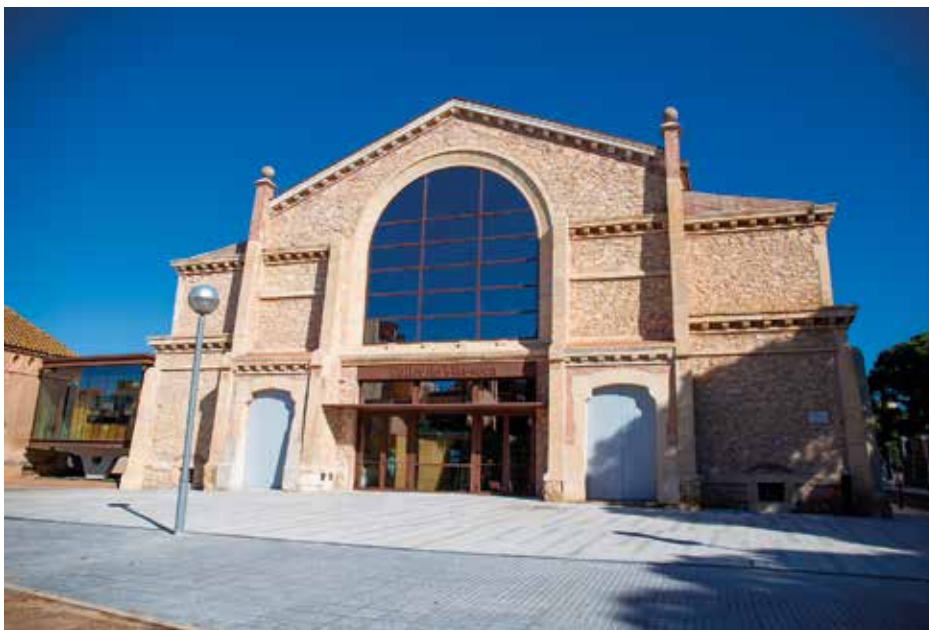
Celler de Vila-seca, actualment edifici multifuncional, museïtzat amb tecnologies de realitat virtual.