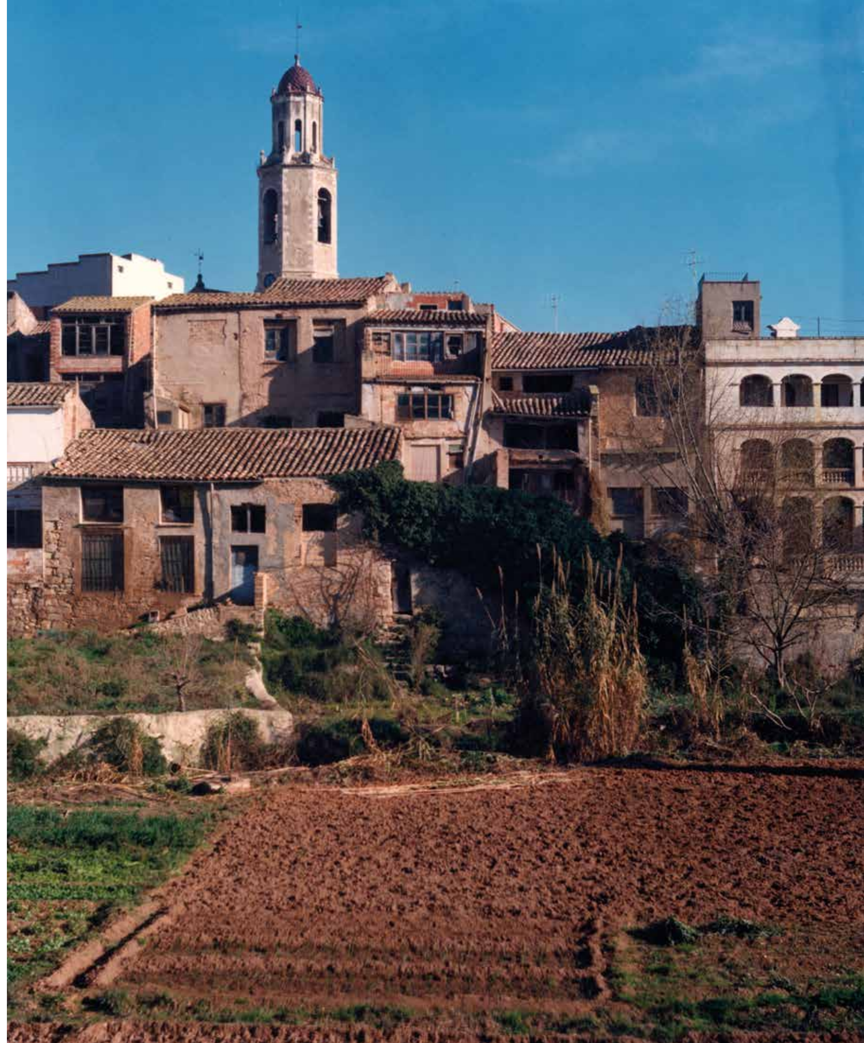
Cabra del Camp. Llibre "Valls Capital de l'Alt Camp", 1990 >

Francesc Català-Roca va voler retornar definitivament a la seva ciutat nadiua, i per això va voler que l'enterressin al cementiri de Valls. Ell que havia voltat mig món fent fotografies va voler quedar-se per sempre més amb la imatge de la seva ciutat i del seu camp. ■