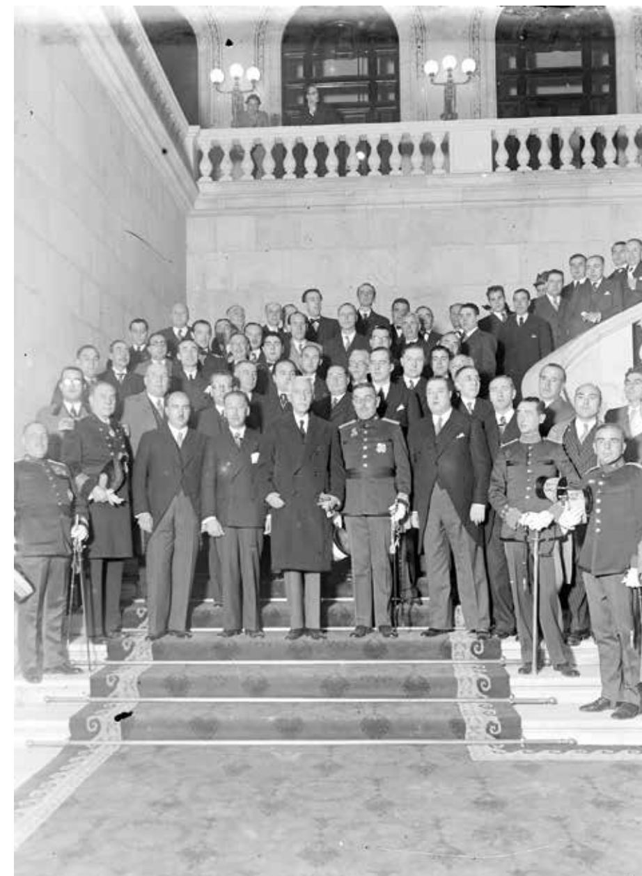
6 de desembre de 1932. Retrat de grup amb motiu de l’acte d’apertura del Parlament de Catalunya. Parc de la Ciutadella, Barcelona.

Certament fou un home d’ideals més que d’idees. Ideals sentits i