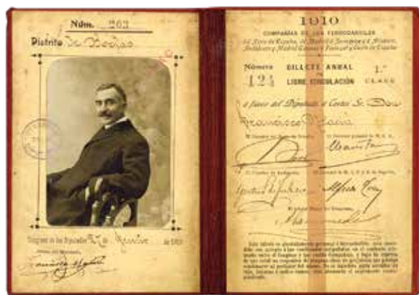
1910. Bitllet de lliure circulació pel Congrés dels Diputats.

Des de 1907 fins a 1923 Macià fou elegit ininterrompudament a les vuit eleccions generals a Corts. L'obra pública que havia fet pels pobles i la denúncia dels problemes concrets del districte li van comportar el suport popular; i la seva condició de terratinent i la seva pertinença a entitats econòmiques provincials li van valdre el suport dels propietaris i sectors benestants de Lleida. Els primers anys de parlamentari dos temes van gairebé monopolitzar les seves intervencions: els problemes comarcals i la modernització de la marina militar espanyola. Va denunciar insistentment