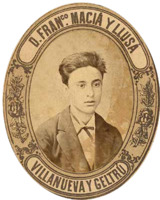
1874. Retrat de bust de Francisco Macià y Llusà, que forma part de l'orla del curs 1874 del Col·legi Lliure de Segon Ensenyament de Vilanova i la Geltrú.