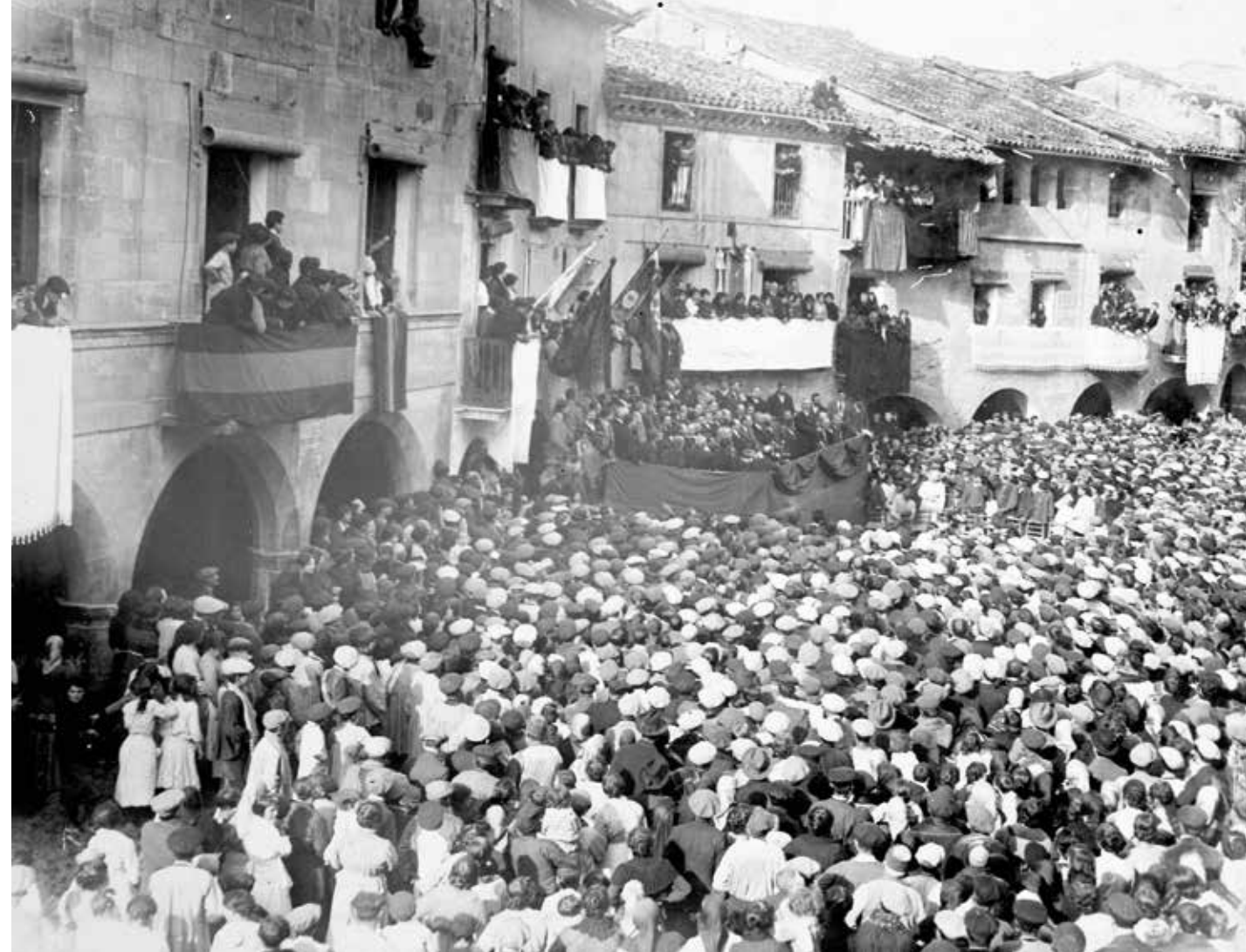
5 de desembre de 1915. Francesc Macià dirigeix unes paraules als vilatans de les Borges Blanques, en un dels actes organitzats amb motiu de l'homenatge que se li va retre després de la seva renúncia com a diputat a Corts.

El novembre de 1905 es produeix a Barcelona l'assalt a la redacció del Cu-Cut! I de La Veu de Catalunya per part d'un grup d'oficials