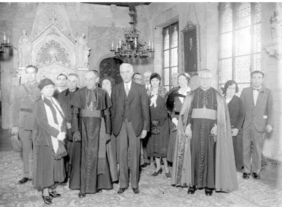
14 d'abril de 1931. Francesc Macià, al Palau de la Generalitat, després d'haver pres possessió de la presidència de la República Catalana. L'acompanyen Josep Maria Bertran de Quintana, Joan Casanovas, Armand Otero i Josep Dencàs, entre d'altres.