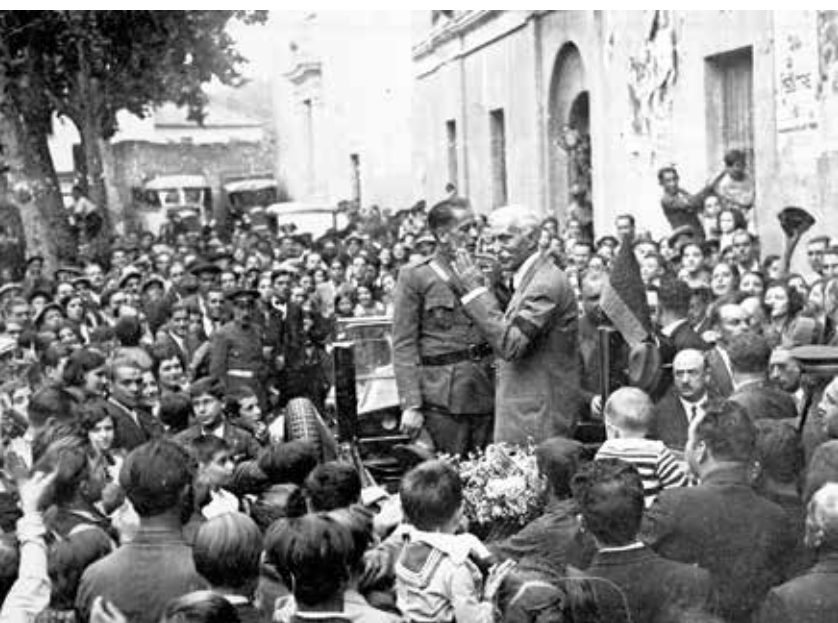
10 de maig de 1931. Francesc Macià, president de la Generalitat de Catalunya, envoltat de ciutadans a Montblanc.