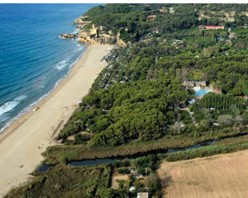
Castell del Catllar. Baix Gaià. La Riera de Gaià. Baix Gaià. Desembocadura del Gaià i platja de Tamarit. Baix Gaià.

poc pendent i poca aigua. La majoria tenen un origen medieval, centrat al segle XIII. Són molins que funcionen amb bassa perquè l'acumulació de l'aigua és el que els permetrà aconseguir la pressió suficient per caure sobre el cacau i moure les moles.