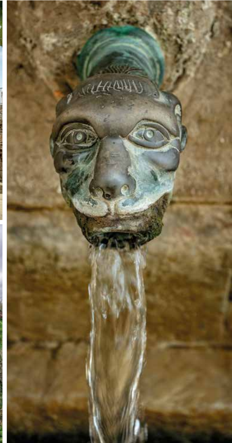
A la pàgina anterior: El riu Gaià al gorg Negre. Querol. Mig Gaià - Font dels Comtes o de les Canelles, s. XVII. Naixement del riu Gaià. Santa Coloma de Queralt. Alt Gaià - Sèquia del molí Nou i antic aqüeducte sobre el riu Gaià. Santa Coloma de Queralt. Alt Gaià.

Maribel Serra · Terres del Gaià