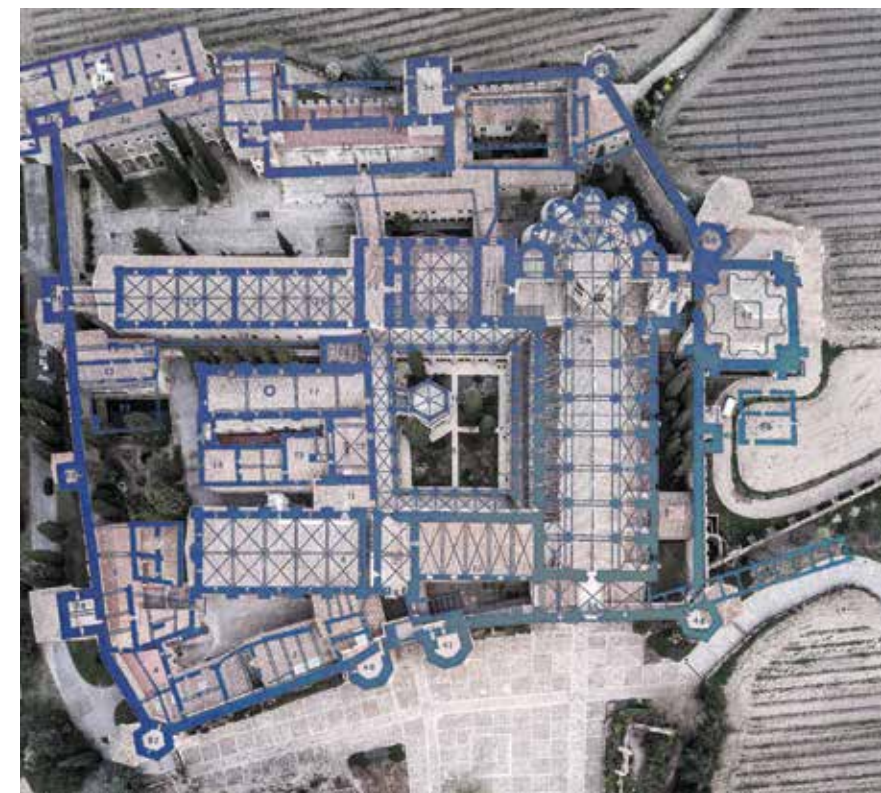
Poblet · Abadia de Fontenay · Abadia de Silvacane. Antiga abadia cistercenca situada a La Roque-d'Anthéron, departament de Bouches-du-Rhône (Provença)

En tots els monestirs sense excepció (i parlem de 351 fundacions només en els primers quaranta anys d'existència de l'orde cistercenc, més unes cent en construcció), es respecta un esquema fix, un organigrama conceptual que s'origina en la rigorosa interpretació