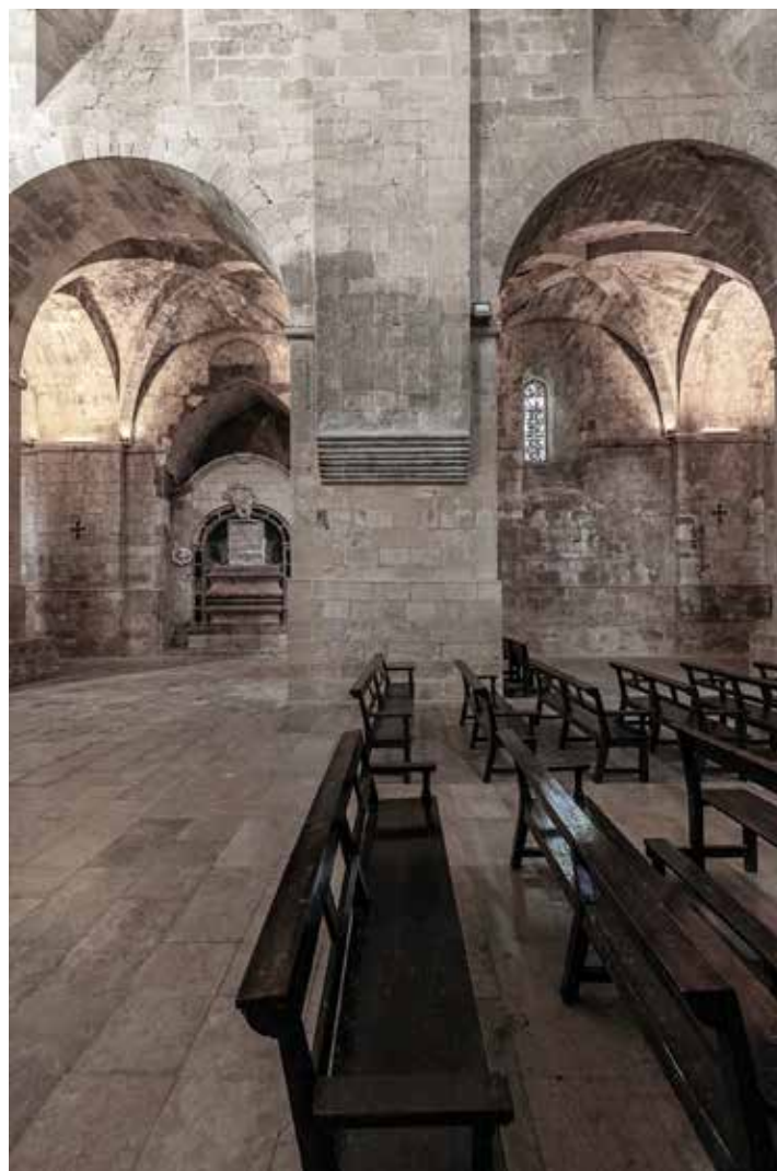
Monestir de Santa Maria de Huerta, Santa Maria de Huerta (Soria) · Santes Creus · Doble pàgina anterior: Abadía de Noirlac

independentment de l'estil i les solucions tècniques emprades. Ho reconeixem fins i tot visitant monestirs modificats i ampliat en diversos estils, cosa que passa sovint.