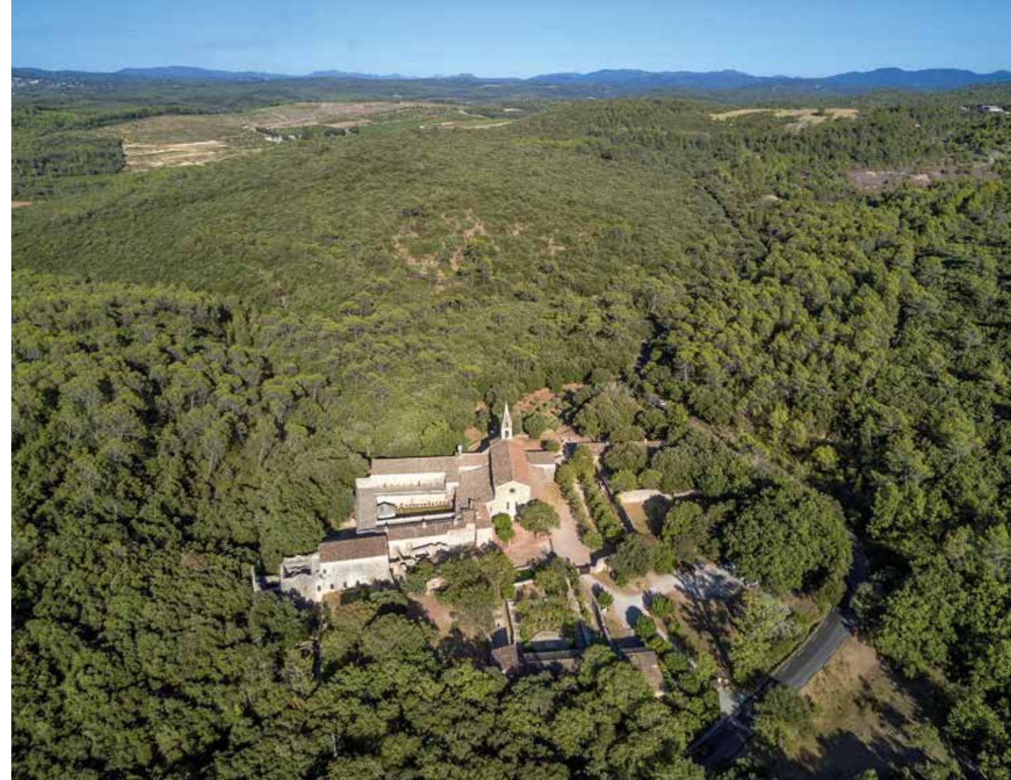
Abadia de Thoronet. Abadia cistercenca situada a Thoronet, departament de Var (Provença)

L'objecte d'aquest article és doble. En primer lloc, convidar el lector que es faci aquestes preguntes. I amb elles, provocar una nova mirada que sigui el resultat de desprendre'ns del vel de la familiaritat. Augmentar el camp de visió tant pel que fa a l'amplitud com a la profunditat. Qüestionar la relació directa i gairebé automàtica que establim entre allò que sabem (història) i allò que veiem i experimentem (arquitectura). I el segon objectiu és apuntar diverses claus que ens permetin aproximar-nos a la pregunta ambiciosa de quina és l'essència de l'arquitectura cistercenca. I amb aquestes claus a la mà, visitar els monestirs i reconèixer l'arquitectura del Cister. Perquè hi és. I és molt bella.