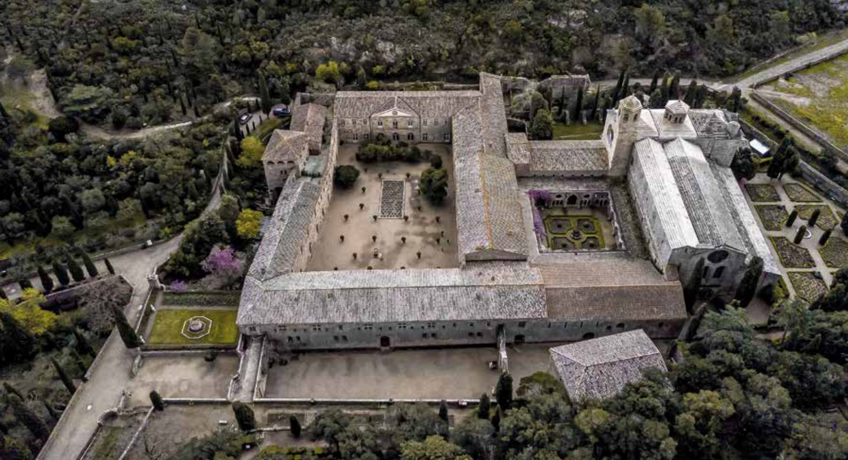
Abadia de Sainte-Marie de Fontfroide. Antiga abadia cistercenca situada a Narbonne, departament de l'Aude (Llenguadoc)

en contacte amb les severes inclemències meteorològiques de la natura en estat salvatge. També ho és en la terra compactada que serveix de paviment a l'església de Fontenay o Fontmorigny. Les tres abadies germanes provençals són un claríssim exemple d'aquest vincle. I especialment, l'entorn exterior de la capçalera de Silvacane, pràcticament igual a la de Santes Creus. En aquesta zona posterior del monestir de l'Alt Camp l'essència del Cister s'hi respira intensament.