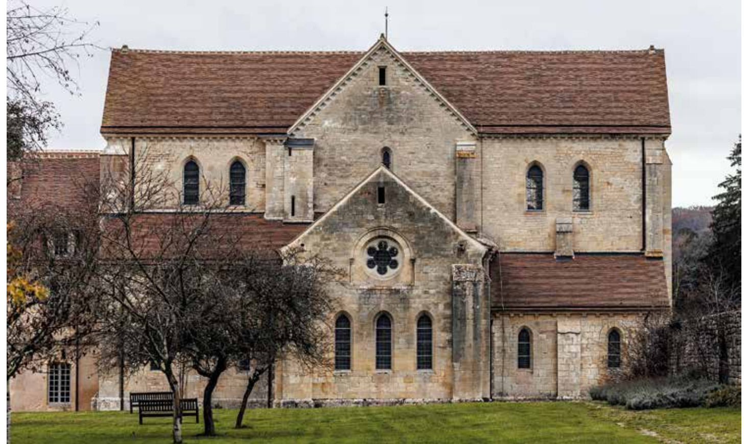
Abadia de Noirlac. Antiga abadia cistercenca situada a Bruère-Allichamps, departament de Cher (Centre-Vall del Loira)