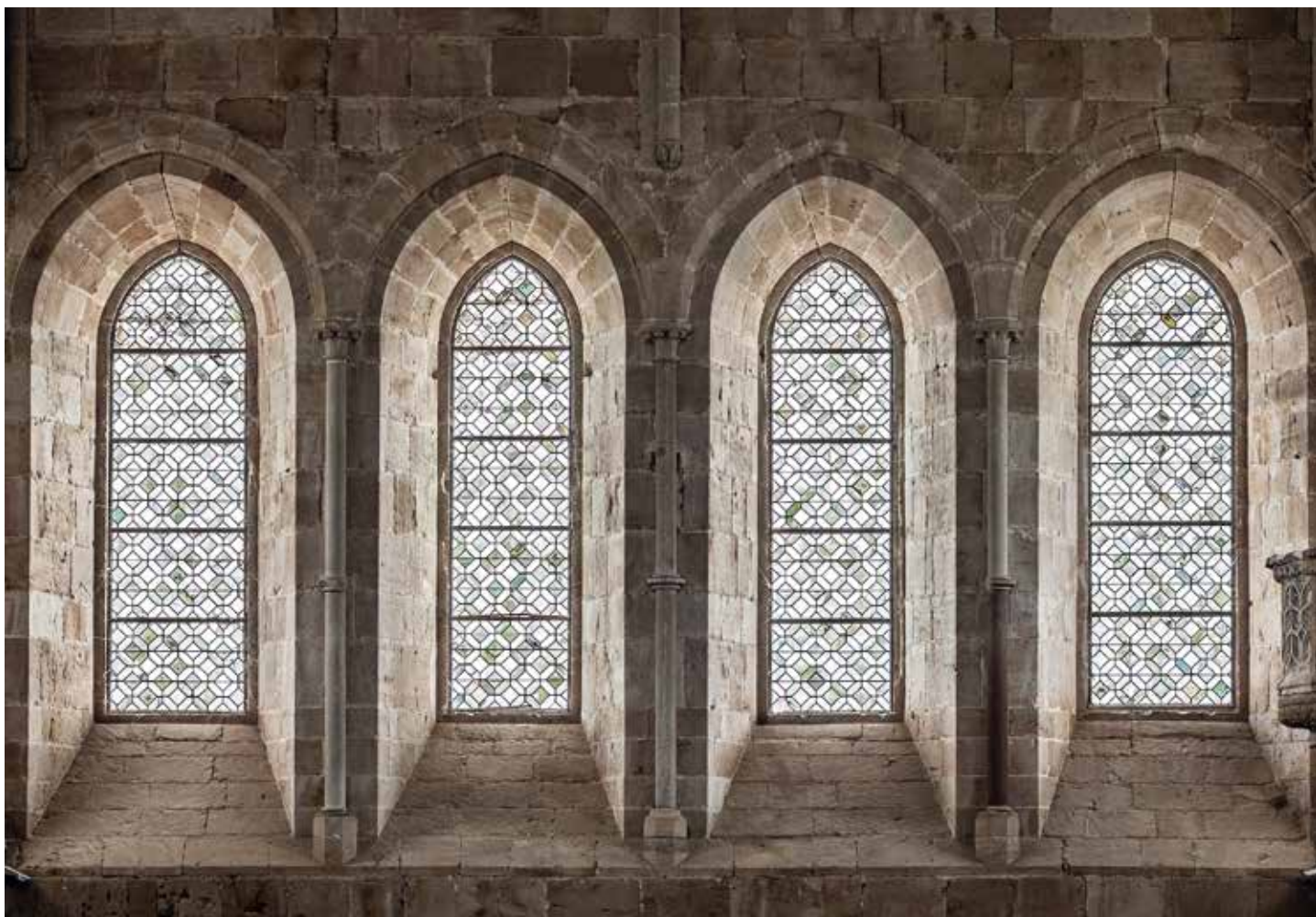
Abadia de Noirlac

cistercencs van agafar de cada moment les millors solucions tècniques que tenien a l'abast. Això ens permet poder gaudir de bells monestirs romànics i altres plenament gòtics. I entre ambdós estils, un extens nombre de construccions en què conviuen tot un ventall de solucions tècniques. Però el que és constant és aquesta meravellosa essencialitat, una sort de metafísica subjacent als estils i que ens emociona.