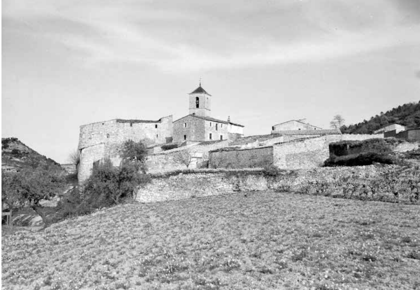
Vista general del poble de Vallfogona de Riucorb, l'església de Santa Maria i el castell c. 1955. ANCI-1236