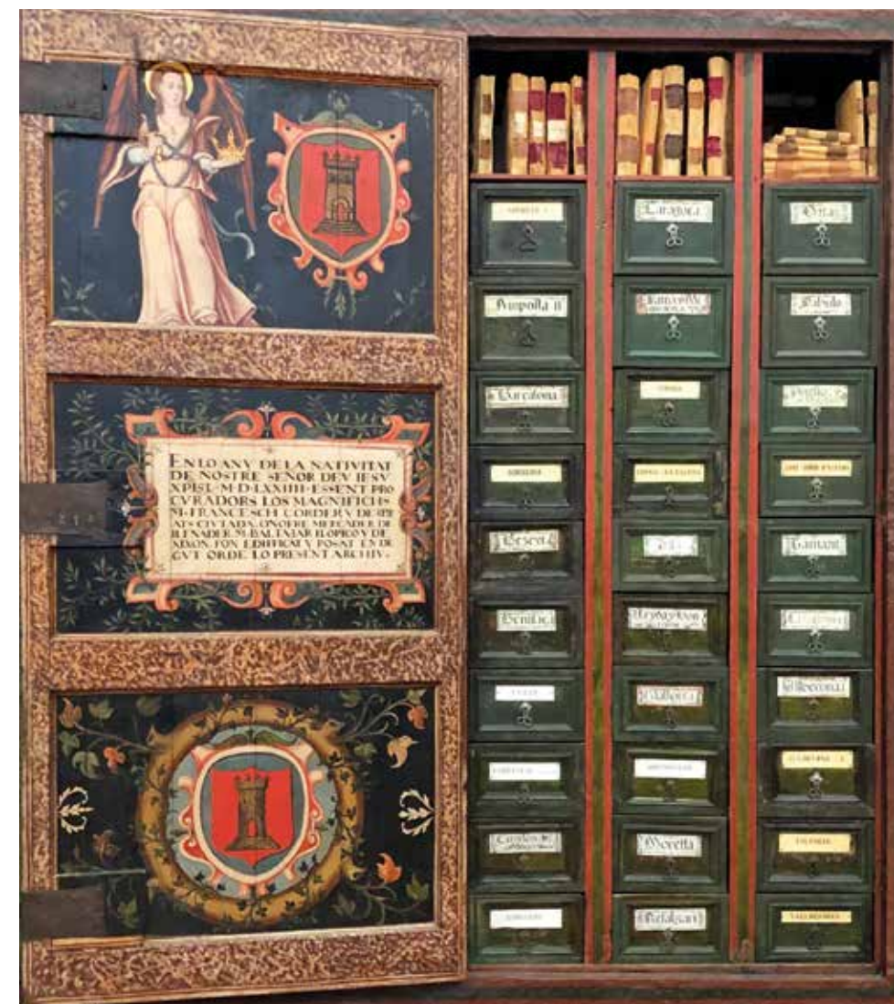
Armari de les tres claus de Tortosa (s. XVIII) Centre d'Interpretació del Renaixement. Antiga església de Sant Domènec, Tortosa