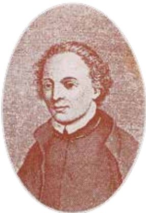
Imatge del Rector i plafó de rajoles amb una poesia en un carrer de Vallfogona de Riucorb