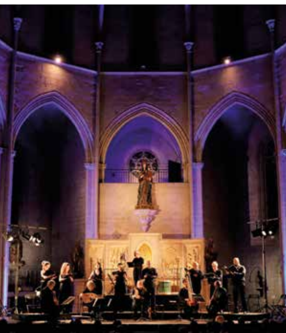
Montblanc. Concert a Santa Maria

Finalment, s'està considerant la possibilitat d'organitzar un festival que, cronològicament, uneixi els diversos escenaris i localitzacions, com ara Santes Creus, Poblet i Montblanc. Des de l'equip organitzador del Festival ja estan treballant en la temàtica i les propostes artístiques de l'edició del 2024. ■