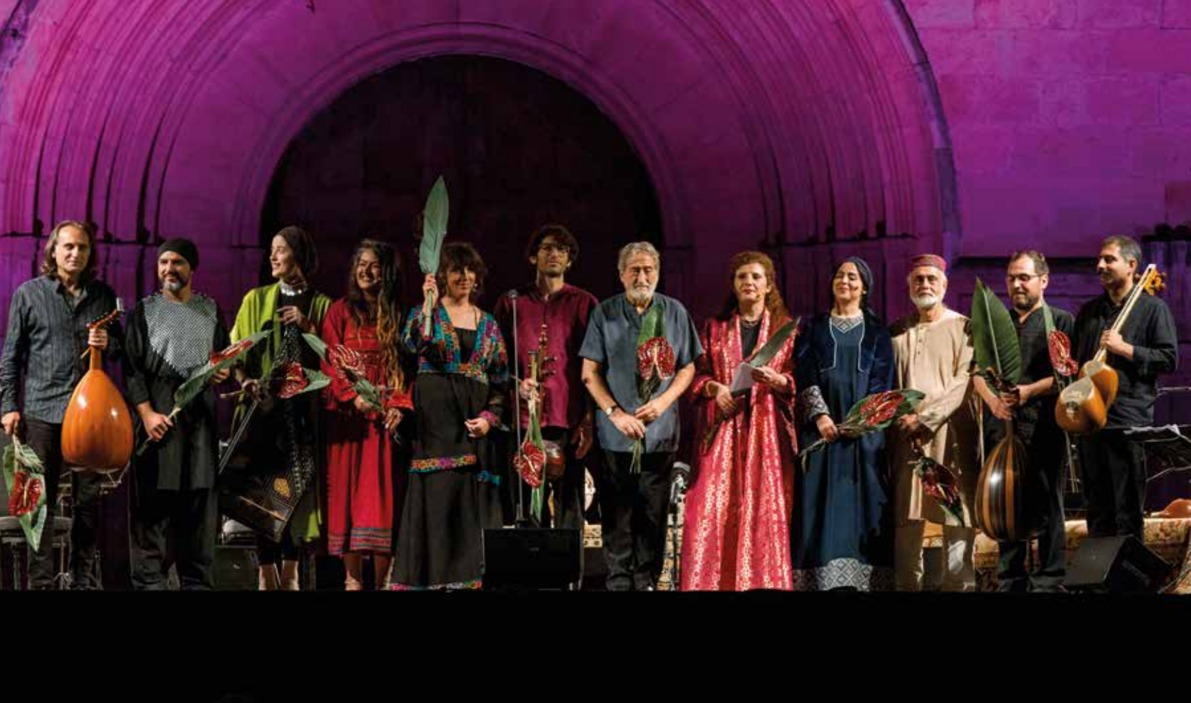
Santes Creus. Concert "Músiques per la vida i la llibertat" © Festival Jordi Savall, 2023

Amb la finalitat de facilitar el desplaçament del públic, s'ha ofert un servei diari d'autocars des de Reus, Tarragona i Barcelona durant els dies del Festival, una iniciativa que es preveu reforçar en les pròximes edicions. El Festival també ha refermat els seus lligams amb el territori; així, ha convidat productors i proveïdors locals a formar part de l' Espai Gastronòmic , complementant, d'aquesta manera, l'experiència musical amb productes de qualitat com els vins i la gastronomia de l'Alt Camp i la Conca de Barberà.