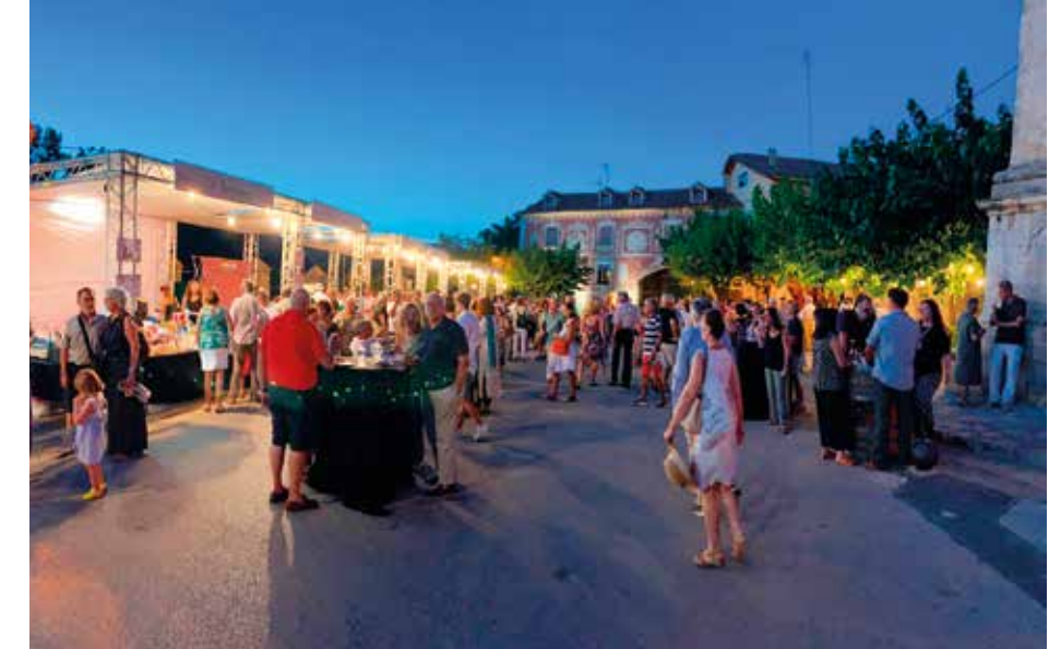
Festival Jordi Savall. Espai gastronòmic

Amb la mirada posada en el futur, el Festival Jordi Savall ja prepara la seva quarta edició per a l'estiu del 2024, amb la in-