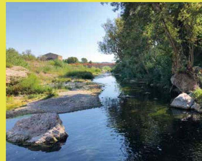
El Francolí al pont de Goi, entre Picamoixons i Valls

Anem baixant per l'Alt Camp i arribem a un altre indret de gran transcendència des del punt de vista històric i natural: el pont de Goi i els seus voltants, amb un assut, al molí d'Alcover, que torna a disminuir de forma considerable el cabal del Francolí, però que proporciona una superfície d'aigües tranquil·les molt interessant per a la fauna. Allà podrem gaudir dels omnipresents ànecs collverds, polles d'aigua, cabussets, bernats pescaires, martinets menuts i blautets. Però també hi veurem abeurar cabirols i senglars, fins i tot, amb molta sort, alguna mostela o fagina. Un