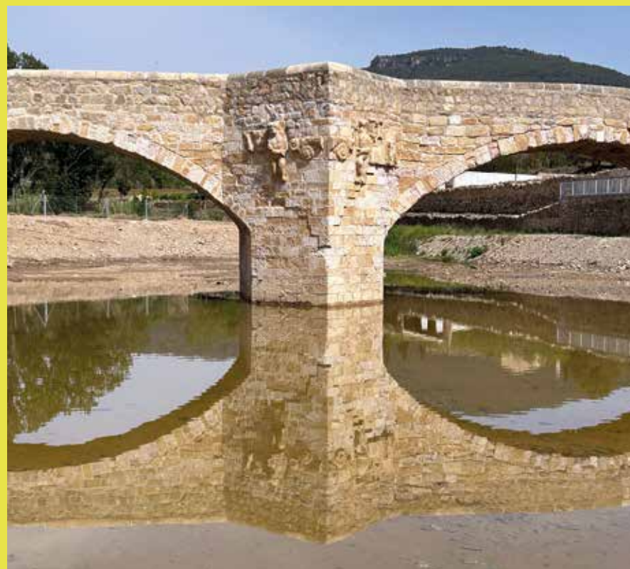
El pont Vell de Montblanc

Les serres del Gaià, l'Alt Gaià, la Voltorera, Miramar, les Guixeres, les muntanyes de Prades, Llaberia, Collejou, els Dedalts de Vandellòs... _i sols hem fet un resum_ són tot un continu de carenes i crestes orientades generalment de NE a SW i que es tanquen gairebé a la costa. I que aquesta sigui la comarca més rica i més poblada de la "Catalunya del Sud" no és casualitat; es deu a un conjunt de característiques i fets, un dels quals, sens dubte, és la presència del protagonista del nostre article: el riu Francolí. Si fem una cerca a la Viquipèdia ja ens diuen de forma taxativa que el Francolí és el riu més important dels que neixen a les comarques de Tarragona. És una afirmació agosarada, tenint en compte que també hi ha el Gaià, per exemple, però ho podem donar per acceptable.