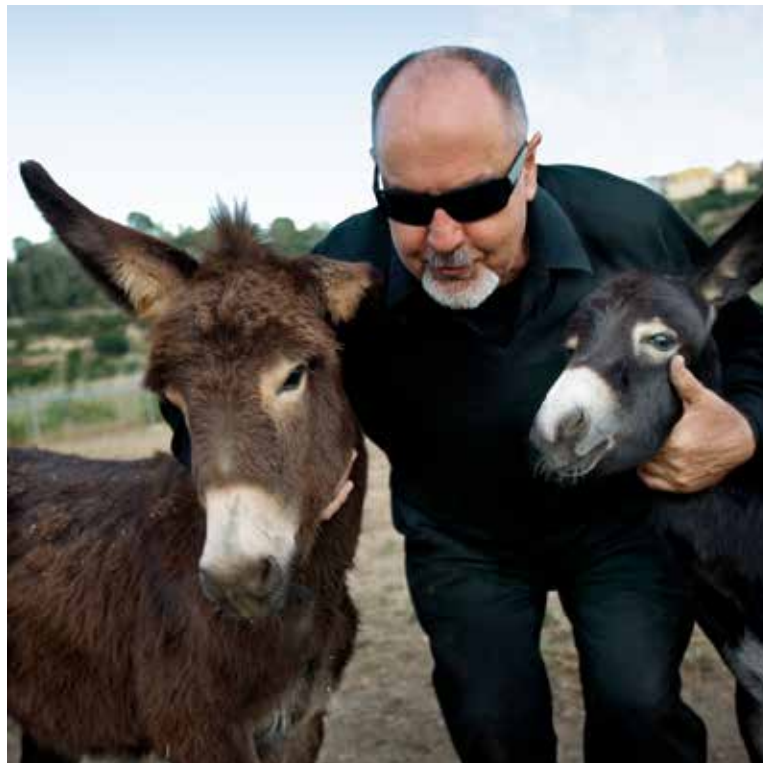
Bigas Luna amb els seus rucs a Virgili. 2007 © Fotografia: Josep Borrell Garciapons

Lactatio. 2000. © Idea de Bigas Luna i fotografia de Josep Borrell Garciapons >