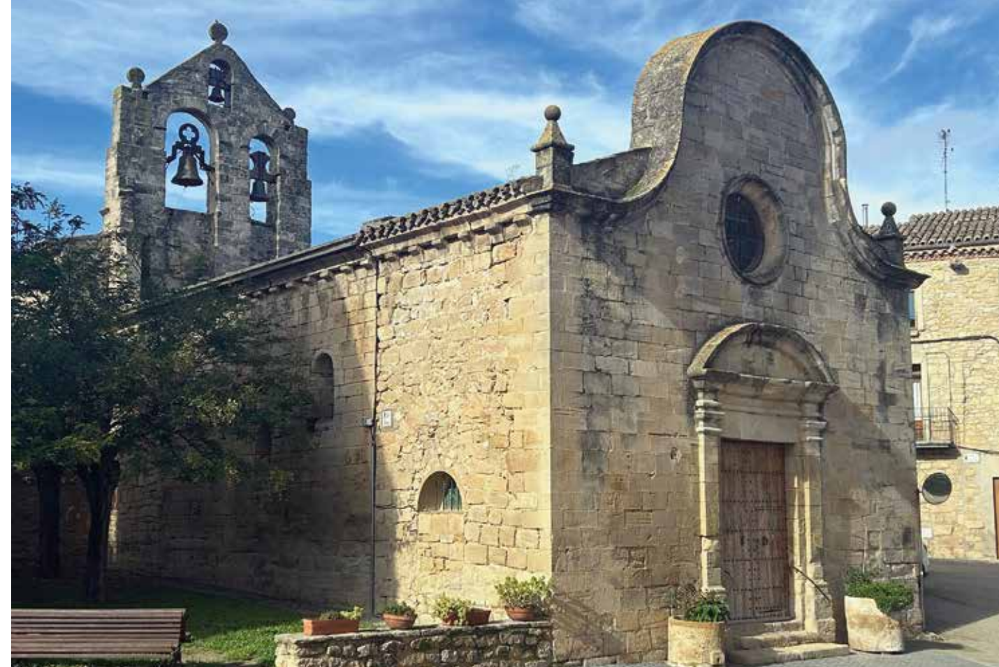
Església de Santa Maria de Fullella