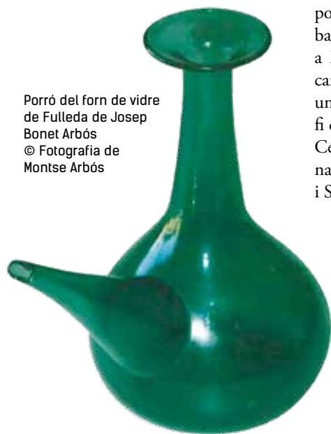
Porró del forn de vidre de Fullela de Josep Bonet Arbós

L'establiment d'un forn de vidre a Fullela i en altres poblacions d'aquesta zona (el Vilosell, la Pobla de Cérvoles, l'Albi i Senan) va ser motivada principalment per la facilitat d'aconseguir grans quantitats de combustible, en els nombrosos boscos del terme, a preus econòmics i sense necessitat de llargs transports. També caldria confirmar si hi havia possibilitats d'aconseguir barrella de manera senzilla a les rodalies. Cronològicament, sembla haver-hi una coincidència entre la fi dels forns de la Pobla de Cérvoles i de l'Albi amb el naixement dels de Fullela i Senan.