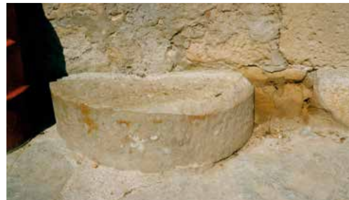
Edificis on hi havia l'antic forn de vidre de Fullela © Fotografia de Ramon Santamaria · Sostre de l'antic forn de vidre l'any 2024 i fragment de mola del forn usada per trencar el vidre © Fotografies de Montse Arbós · Vidrier amb canya i aprenents. 1917. Forn de gresols de la UVE de Cornellà. Fons AFCEC