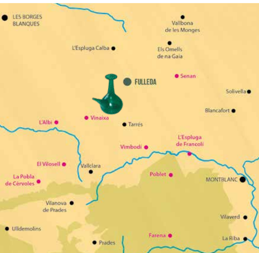
Mapa de les poblacions properes a Fullella on hi hagué forn de vidre

segle XIX, després d'una llarga decadència, la indústria vidriera de Mataró torna a agafar embranzida, a la qual contribueixen també vidriers de Fullella, la població que, després de Barcelona, més operaris hi aporta. I fins i tot més lluny, ja que documentem que Feliu Caçador Codines, vidrier de Fullella nascut el 1776, cap als anys 30 del segle XIX exerceix l'ofici a Mallorca.