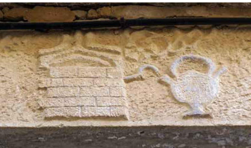
Llinda de cal Coixet, al Raval, a la casa on habitava un vidrier. Es pot veure clarament un càntir i una estructura que representa un forn de vidre amb el fum que surt per dalt