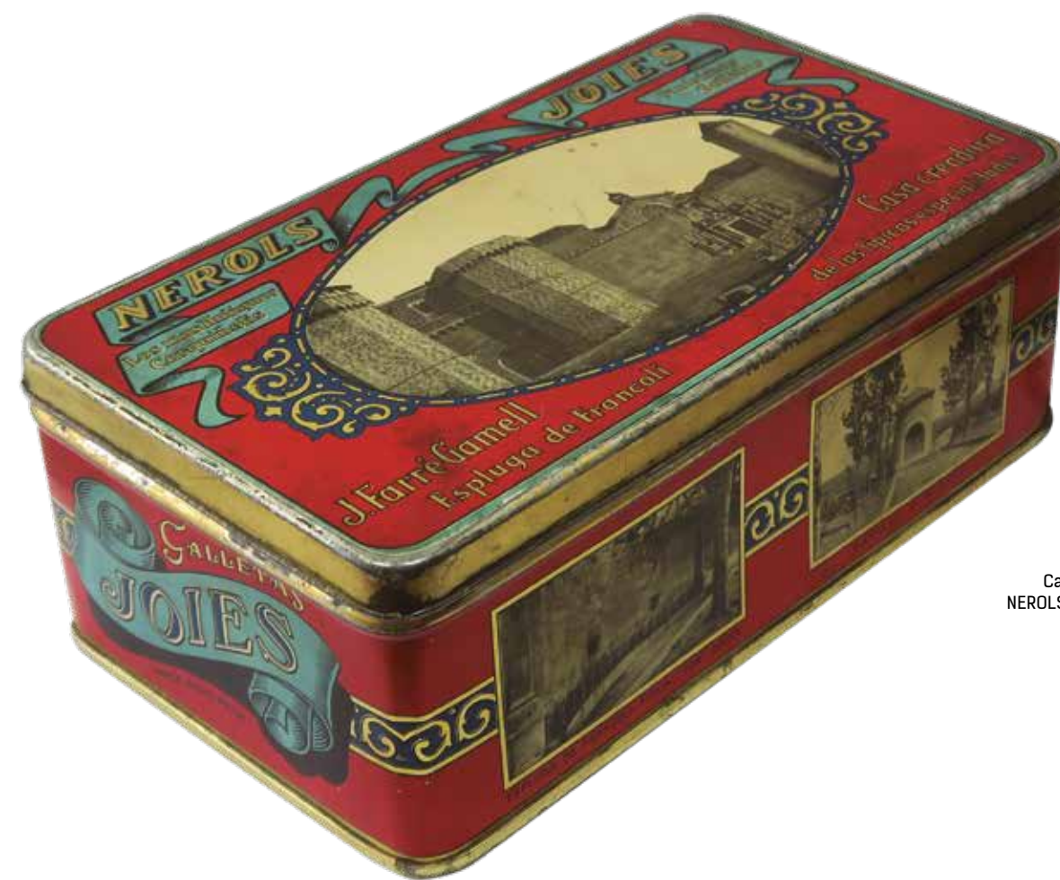
Capsa de carquinyolis NEROLS de J. Farré Gamell.

El jove Joan Farré Gamell es va integrar ràpidament a la vida social espluguina. Durant el mes d'abril de 1914 es va intentar crear una societat cultural,