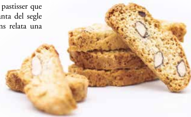
Carquinyolis de l'Esplugu de Francolí.