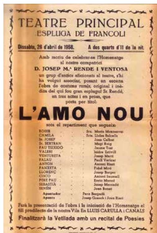
Programa.